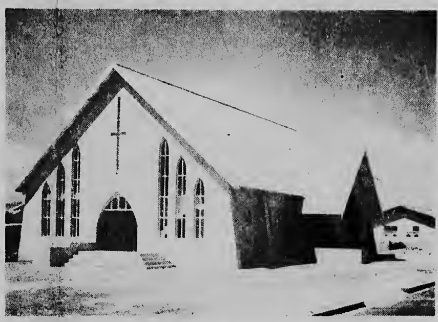
Duidelijk komt op deze foto het architectonisch schoon van de Zeyende Dag Adventistenkerk naar voren.